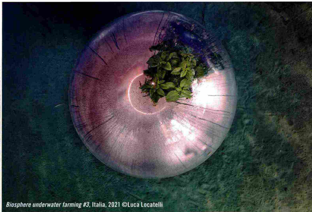
Biosphere underwater farming #3, Italia, 2021

Patria del jeans, Genova guida la ricerca dell'innovazione responsabile tessile. E dal 5 all'8 ottobre, ospita GenovaJeans: quattro giorni dedicati al denim di nuova generazione, sostenibile e circolare con talk, installazioni artistiche e spettacoli. genovajeans.it