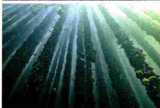
Dall'alto, tre scatti di Luca Locatelli del 2022. Carbon capture machine #3 , Islanda. Ice Cave - Vatnajökull , Islanda. Nature power mussels farming #1 , Spagna.